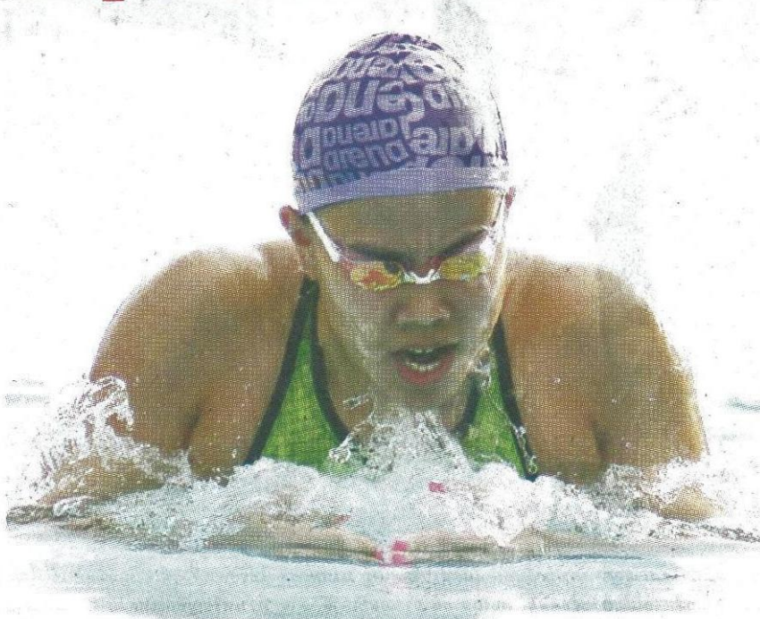
สามารถว่ายได้หลายท่า ทำให้กวาดเหรียญทองเป็นกอบเป็นกำให้จุฬาฯ

ใน "พลบดีเกมส์" กีฬาที่ทำเหรียญทองให้กับจุฬาฯ อย่างเป็นกอบเป็นกำมากที่สุดเห็นจะไม่พ้นกีฬาว่ายน้ำ ที่มีฉลามหนุ่มและเงือกสาวหลายคนช่วยกันทำเหรียญให้ได้ทุกวันอย่างน้อยวันละ 5 เหรียญ